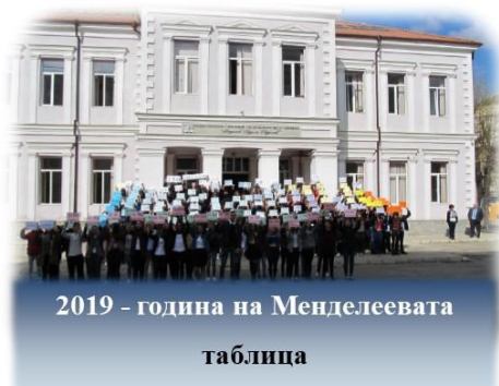
2019 - година на Менделеевата таблица

На 6 март 2019 г. се навършиха 150 години от формулирането на Периодичната таблица на химическите елементи.